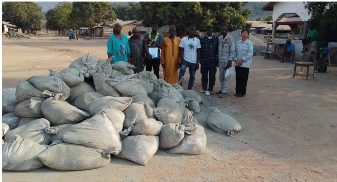
Image3 : remise des sacs de ciment