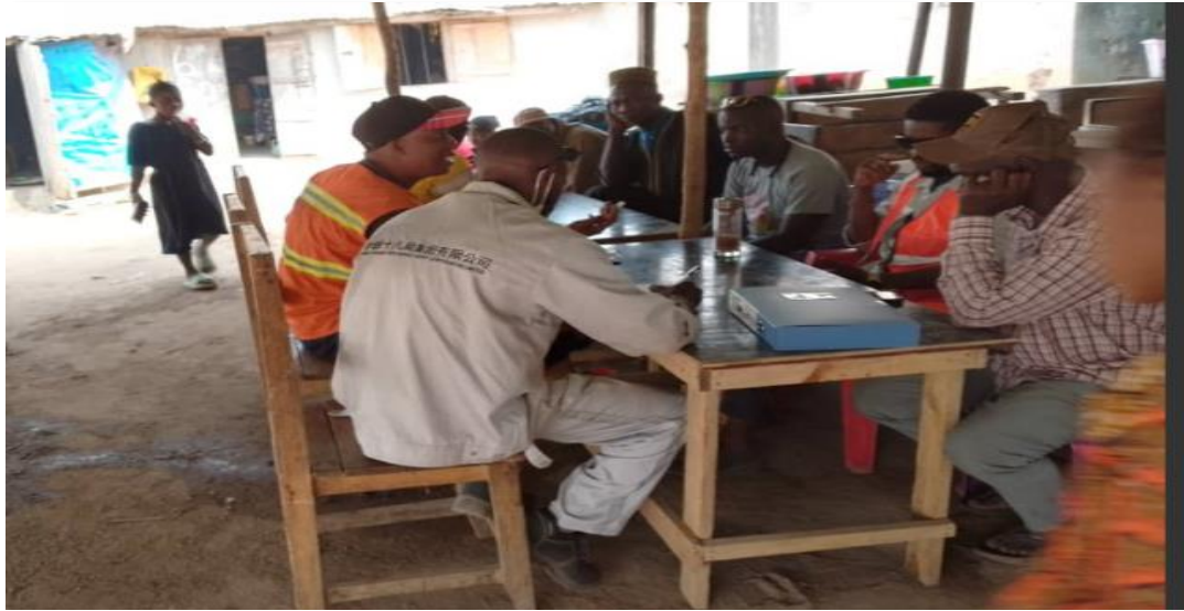
Image 2 : réunion de négociation entre le comité et l'entreprise CRCC 18 le 27/02/2025