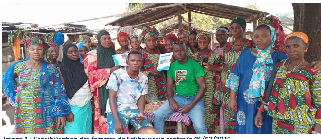
Image 1 : Sensibilisation des femmes de Sekhousoria centre le 06/02/2025

Pendant les trois (3) mois couverts par ce rapport, le comité a organisé Six (6) séances de sensibilisation dans le district de Sekhousoria. Ces séances ont permis de toucher 85 personnes, dont 54 femmes.