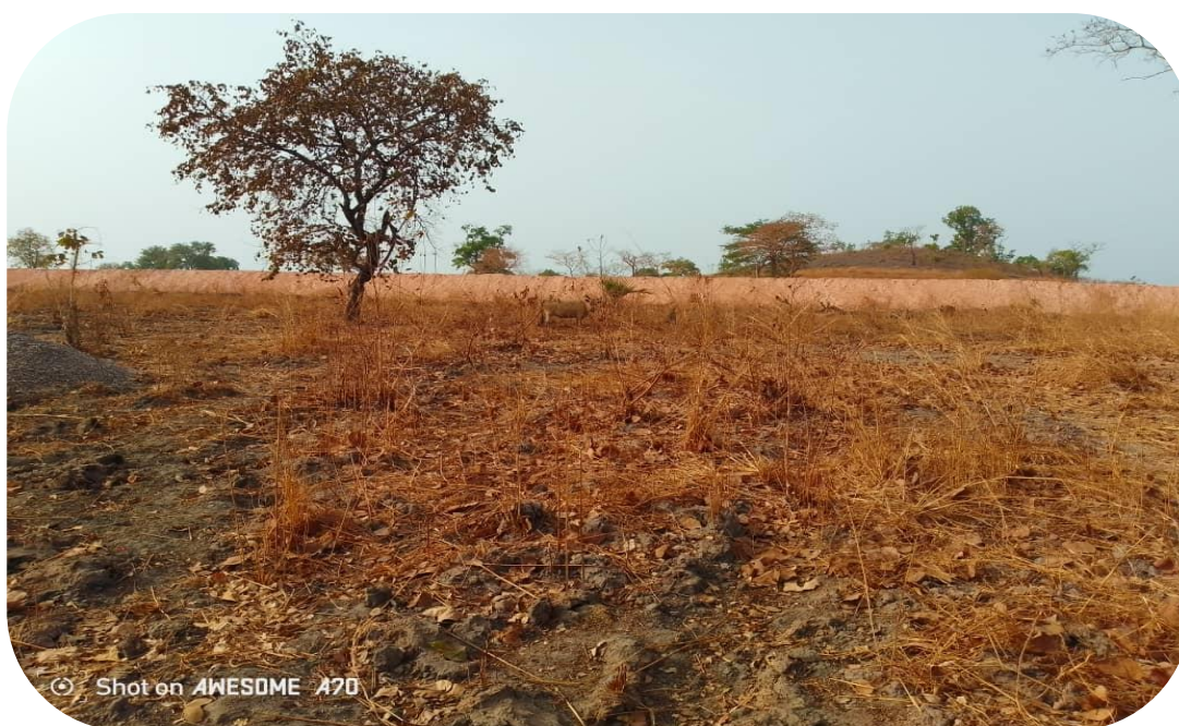
Image d'un domaine agricole pollué à Sékhousoria